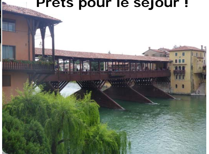
Le pont de Bassano Ville