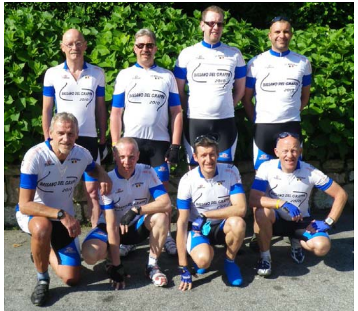
Prêts pour le séjour !