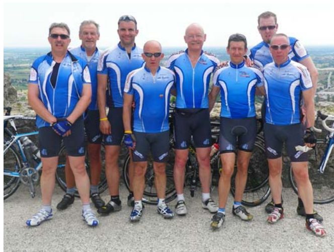
Au sommet de la citadelle de Marostica