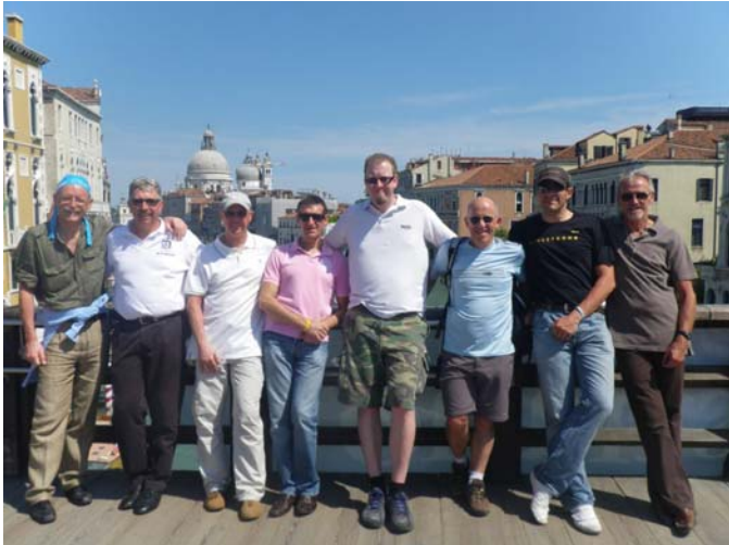
Visite de Venise...