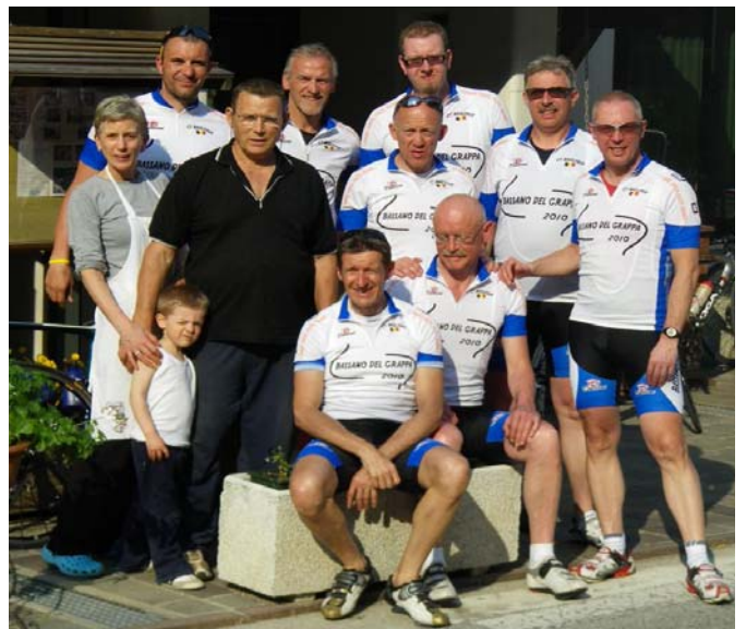
Avec les charmants patrons de l'Hôtel